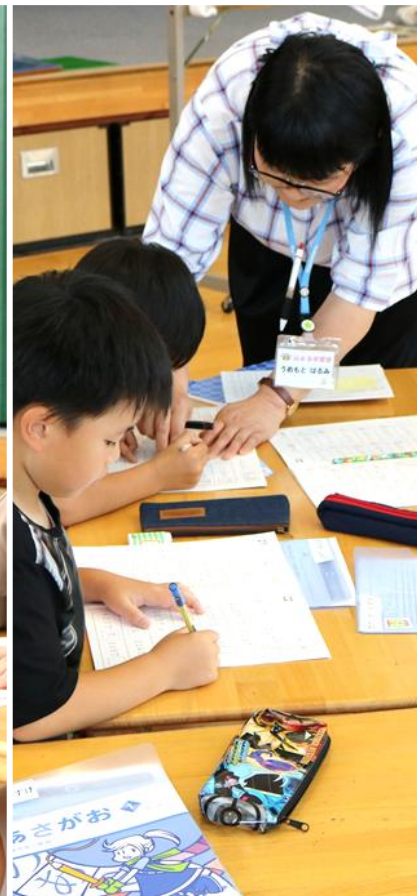
【木曜日】 はなまる学習会