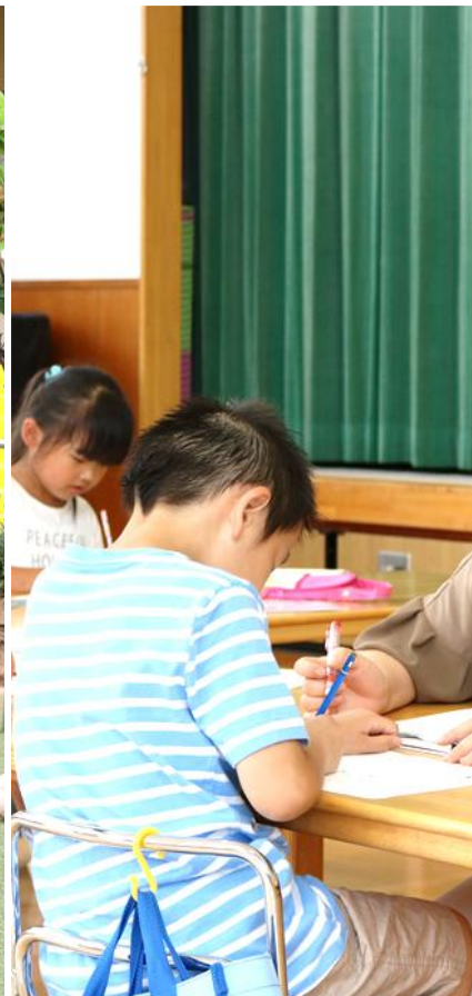
【水曜日】 プレイルーム スタディールーム