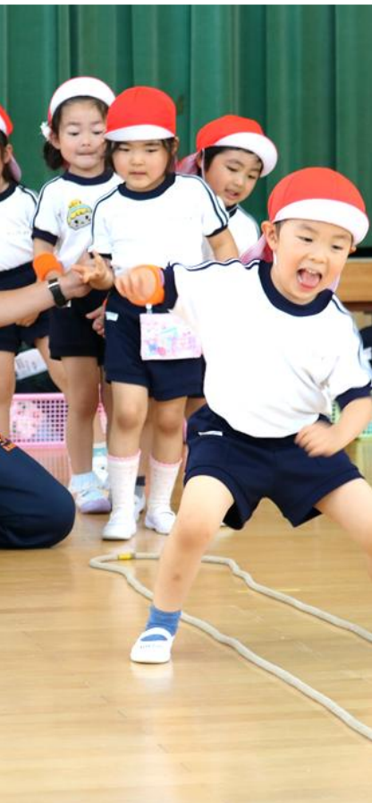
【月曜日】 体操クラブ