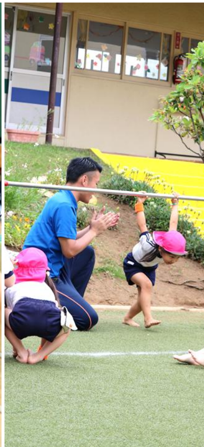
【火曜日】 体操クラブ